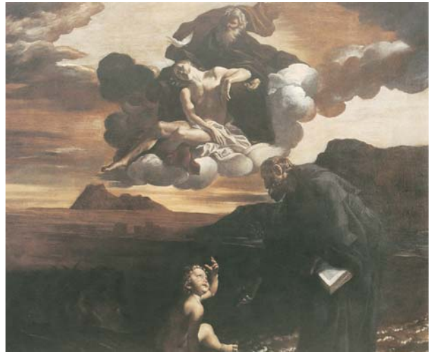
Giovanni Lanfranco, S. Agostino medita sul mistero della Trinità, 1615 - Roma, Sant'Agostino, Cappella Bongiovanni.

Quando alcuni ragazzi contattati hanno chiesto ulteriori informazioni sul significato del coro, ho capito che vi era un terreno fertile per raggiungere l'obiettivo pre-